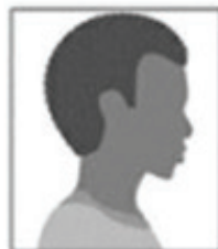
Figura 2. Modelo de Foto de Perfil

III- um vídeo individual recente (com, no máximo, 30MB e de até 30 segundos de tempo de duração), contendo resumidamente sua autodeclaração, a qual o candidato deverá iniciar dizendo: